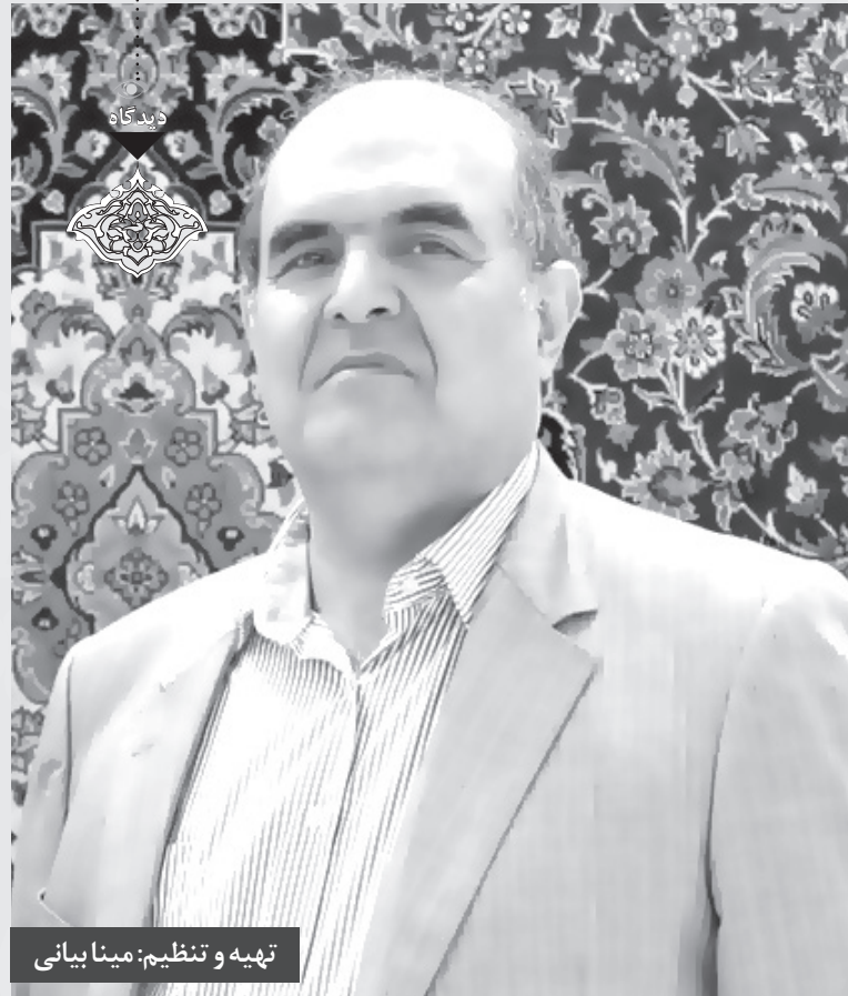
تهیه و تنظیم: مینا بیانی

مطلب بعد این که قیمت تمام شده ماشین‌های هزار یا ۱۵۰۰ شانه، حدود ۶۰ تا ۷۰ میلیارد تومان است که شاید در نگاه نخست خرید آن توجیه پذیر نباشد اما اگر دولت جدید تسهیلات مالی مناسب در اختیار تولیدکنندگان فرش ماشینی قرار دهند؛ دیگر فعالان این صنعت از خرید ماشین‌های دسته دوم خودداری خواهند کرد و تهیه ماشین‌آلات جدید و منطبق با تکنولوژی‌های روز دنیا تبدیل به گزینه نخست آنان می‌شود. به هر حال ماشین‌های قدیمی و کارکرده، عمر مفید خود را پشت سر گذاشته‌اند و مستهلک شده‌اند که تقبل هزینه‌های سنگین جهت تعمیر و نگهداری آنها در شرایط فعلی منطقی به نظر نمی‌رسد.